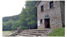
Pradera de Ordesa

en horario ininterrumpido de 8:00 a 17:00 h