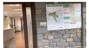
C/ Iglesia, s/n. 22375. Fanlo. Tel. 974 94 81 50