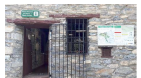
C/ Única, s/n. 22362. Escuaín. Tel. 974 94 15 60

C/ La Iglesia, s/n. 22364. Tella. Tel. 974 34 66 77