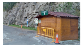
Aparcamiento de San Úrbez Cañón de Añisclo

Avda. Pineta. Ed. Portal de Añisclo, 9. 22363. Escalona. Tel. 974 50 51 31